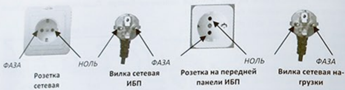
Рис.5. Фазировка основных элементов системы бесперебойного питания.